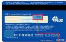
セキュリティコード

※「cvcセキュリティコード」は カード裏面などにある3～4桁の番号です。 (右図を参照)