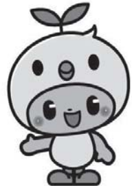
エコチル信州シンボルキャラクター「エコぴよ」

みなさんの協力により実現する13年間という長期間の調査は、その後のデータ解析を経て、これから生まれてくる子どもたちの病気の予防や対策にも大きく貢献します。