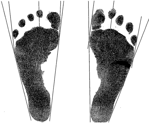
図8 Mさん 50代女性 1回目 footprint 2004.10.19採取